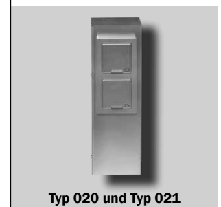
Typ 020 und Typ 021

Höhe: 30,00 cm Breite: 10,00 cm Tiefe: 8,00 cm